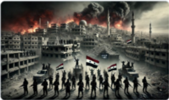
Poslední úprava 5:21 odp. · 8. 12. 2024 · 32,3 tis. Zobrazení

P. S. Z Prahy do Damašku je to o 3 tis. km blíže než do afghánského Kábulu. Podobnost to může a také nemusí být čistě náhodná.