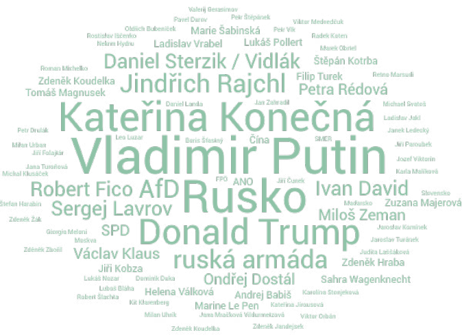
Graf: Nejvíc podporované subjekty na webech za měsíc září 2024.